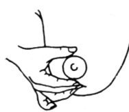
1. ÁBRA: UJJAK RÁHELYEZÉSE A MELLRE