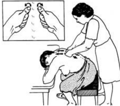
1. ÁBRA: A WHO 20 ÓRÁS TANFOLYAM ANYAGÁBÓL